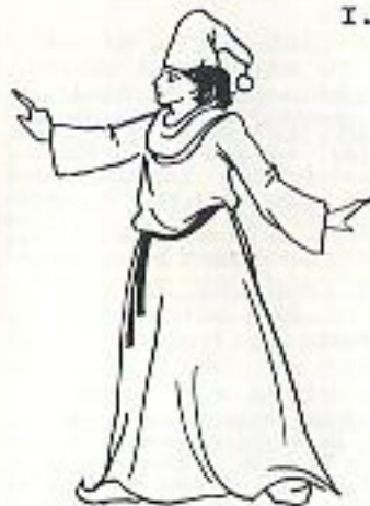
Bebo Magician Apprentice

At the top of Mount Althus lies an ancient, brooding castle, the Castle of Deceit. It served as a gateway to six other universes and dimensions. At the center of the castle rests six magical stones, the Runes of Guarding. The Runes were guarded by Phylax, a mystic Emerald Magic. He dwelled within the energies created by interaction of the stones century after century until at last it drove him insane. The power of the stones gave life to the hallucinations of his madness, thus creating six deadly beings which stole the runes and fled to the six universes.