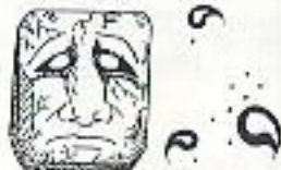
Idol of the Four Winds