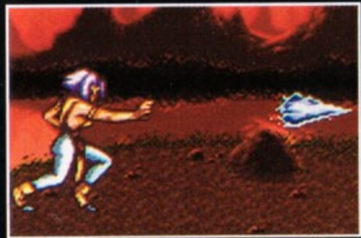
コマンド技 氷結弾:ひょうけつだん [十字キーの下→上→Yボタン]