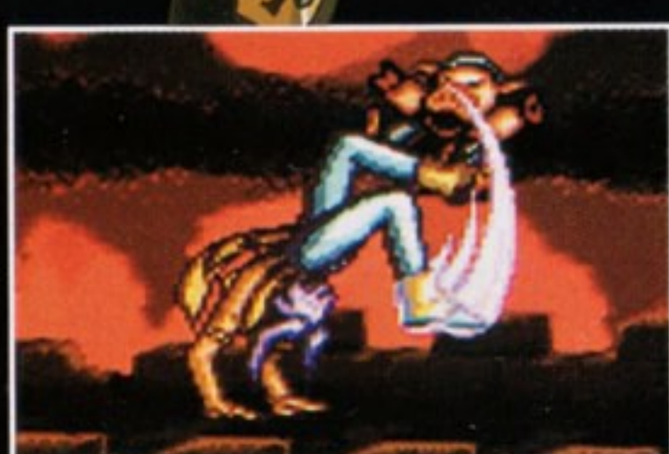
必殺技 夏塩脚:かえんきゃく [Y+Bボタン同時押し]