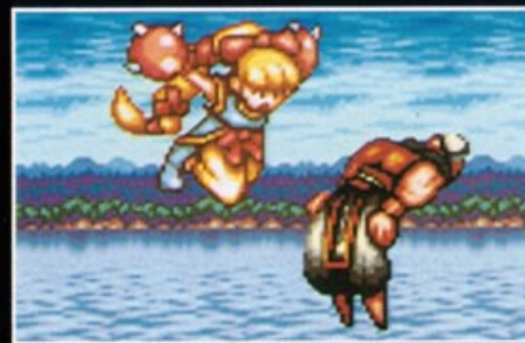
ひざ落とし [ジャンプ中、十字キーの 下+Yボタン同時押し]