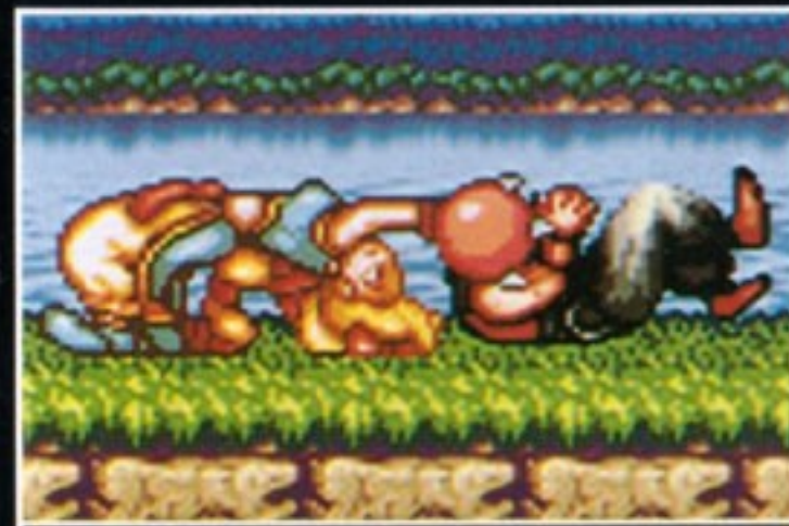
ジャーマンスープレックス [つかんだ状態で十字キーの 上+Yボタン同時押し]