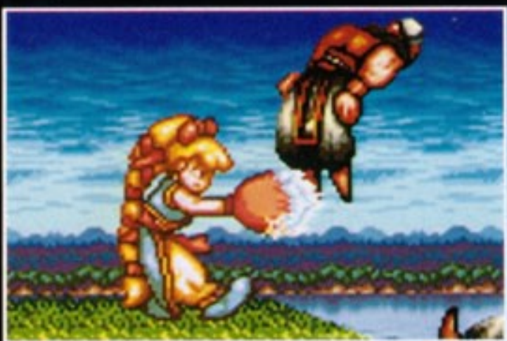
必殺技 爆碎双拳:ばくさいそうけん [Y+Bボタン同時押し]