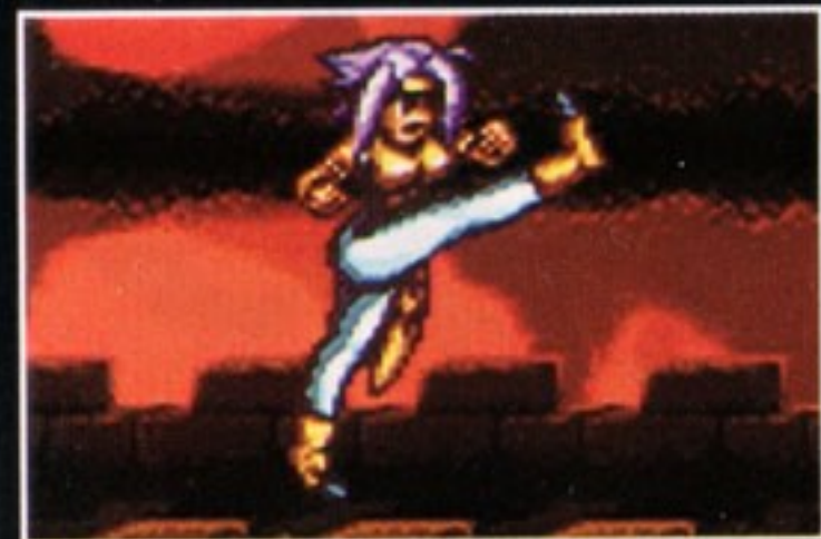
特殊攻撃 蹴り上げ [十字キーの上+Yボタン同時押し]

南レンベン歴 741年5月28日生 AB型 属性・水気 理知的で思索好きな18歳。 物静かで、真理を求めてやまない 孤高の哲学者です。 スピーディーな攻撃を 得意としています。