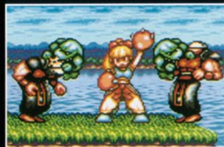
方術[Xボタン] 波無寿の方術は、気ので 様々な支援キャラクターを 召喚するものです。