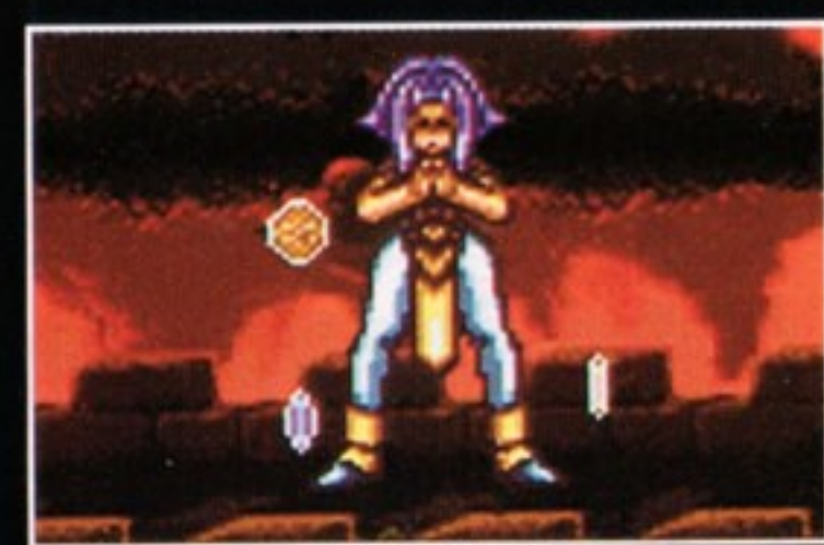
方術[Xボタン] 河意留の方術は、 水気によって敵に ダメージを与えるものです