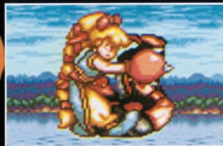
ジャンピングパワーボム [ジャンプ中、 敵に密着してYボタン]