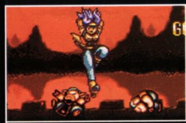
鷹爪脚:たかつめきゃく [ジャンプ中、十字キーの 下+Yボタン同時押し]