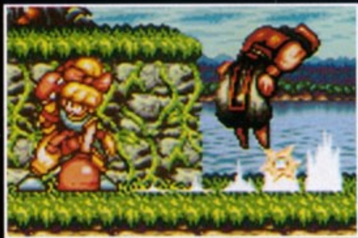
コマンド技 烈竜破弾:れつりゅうはだん [十字キーの下→上→Yボタン]