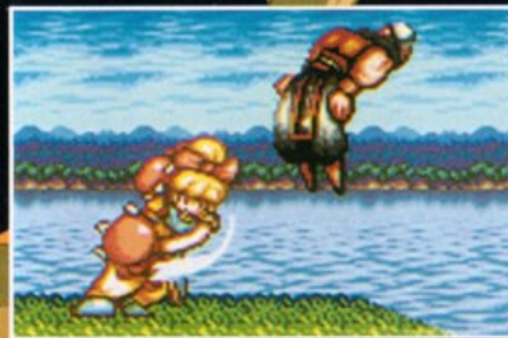
特殊技 ダッシュストレート [Yボタンを押し、全身が明るく 光りだしたら離す]