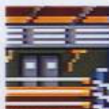
リング (ロープを使った攻撃が可能)