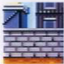
空き地 (砂かけ攻撃が可能)