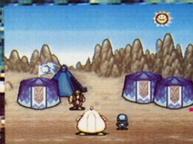
ミントキャンディ