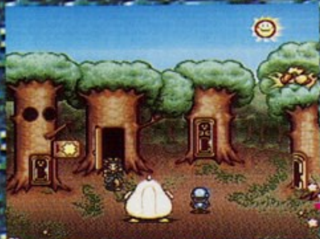
ストロベリーパイ